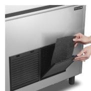
Легко очищаемый фильтр конденсатора

Льдогенератор ТС оснащен системой воздушного охлаждения с низким энергопотреблением. Это означает, что он втягивает окружающий воздух и использует его в системе охлаждения. Поэтому на производительность работы льдогенератора влияет температура окружающей среды, а также температура используемой воды.