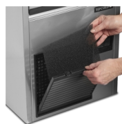
Легко очищаемый фильтр конденсатора

Льдогенератор TC оснащен системой воздушного охлаждения с низким энергопотреблением. Это означает, что он втягивает окружающий воздух и использует его в системе охлаждения. Поэтому на производительность работы льдогенератора влияет температура окружающей среды, а также температура используемой воды.