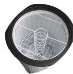
Внутренний вентилятор и 2 корзины