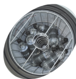
Внутренний вентилятор и корзина